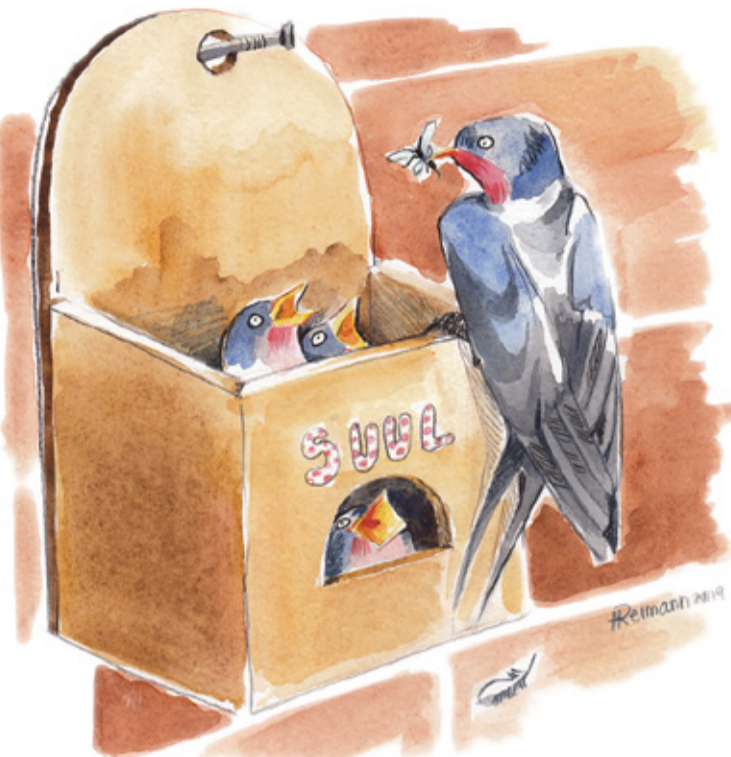
REIMANNI HILDEGARDI TSEHKENDÜS

Mi ellime katõkõrdsõ maja tõsõ kõrra pääl otsmadsõh kortõrih. Maja mipuulsõhe otsa olle ehitet üt' kuurimuudu ehitüs, mille kaartõviir olle mi rõdu ülemäde veerega tasa. Sinnä kaartõ ala olliva pääsokõsõ uma pesäkese tennü, piazõ rõdu ülemäde-