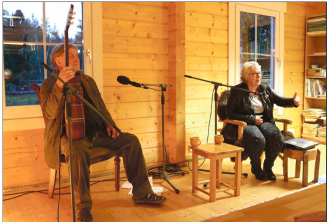
RAHMANI JANI PILDIT