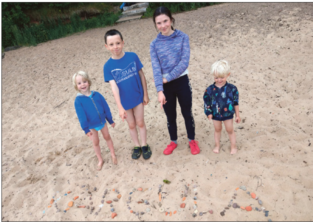
EPLERI RAINI PILT

Et mi Tarto liina kuigi minnä ei taha, tulõ kuigimuudu Imājõõst üle saia. Olõmi kostki kuulõnu, et Kavastun sõit praam üle jõõ. Jäämi tuu pääle luutma ja tulõmi Parveotsa bussipiätüste. Üts häädä viil: Kavastust ei saa samal pääväl ināmb bussiga edesi Koosalõ, kost sis sõita bussiga edesi Varnja lähküle Kasepää küllä, kon edisi