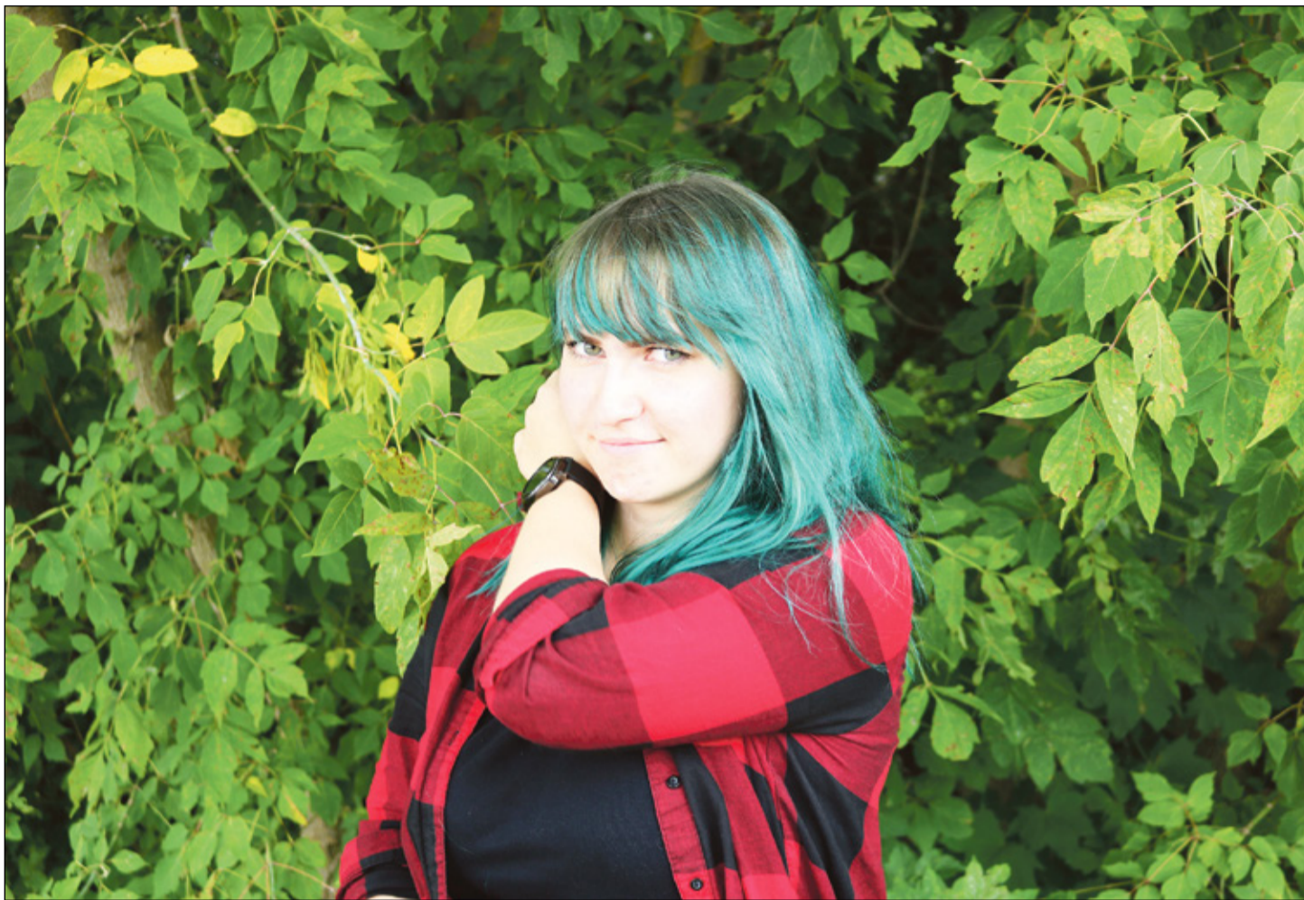
RAHMANI HEBO PILT

Mõtõ laagrit kõrralda tull' umast elost Jõudsõ laagri kõrraldamisõ mano niimuudu, et opsõ aasta aigu tagasi Villändin hoobis perimüsmuusiga eriala pääl väikutkannõd.