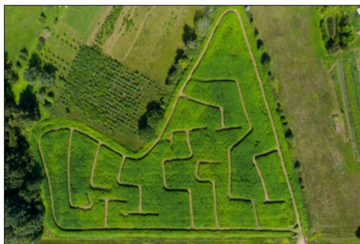
MÜÜRSEPA TUULE PILT

Säälsaman olf üles säet ka valgusmõts ja sai nätä uhkõt valgusetendüst. Kanepi seldimajaja man peeti laatu, kon müüdi kotsuspäälisist ja kanebikasvõst tettüt kraami. Huvilidsõ saiva ossa võtta tsihiotismismängust NutiKanep, miä tutvusf Kanepi valda, ja kävvü kanebilabürindin,