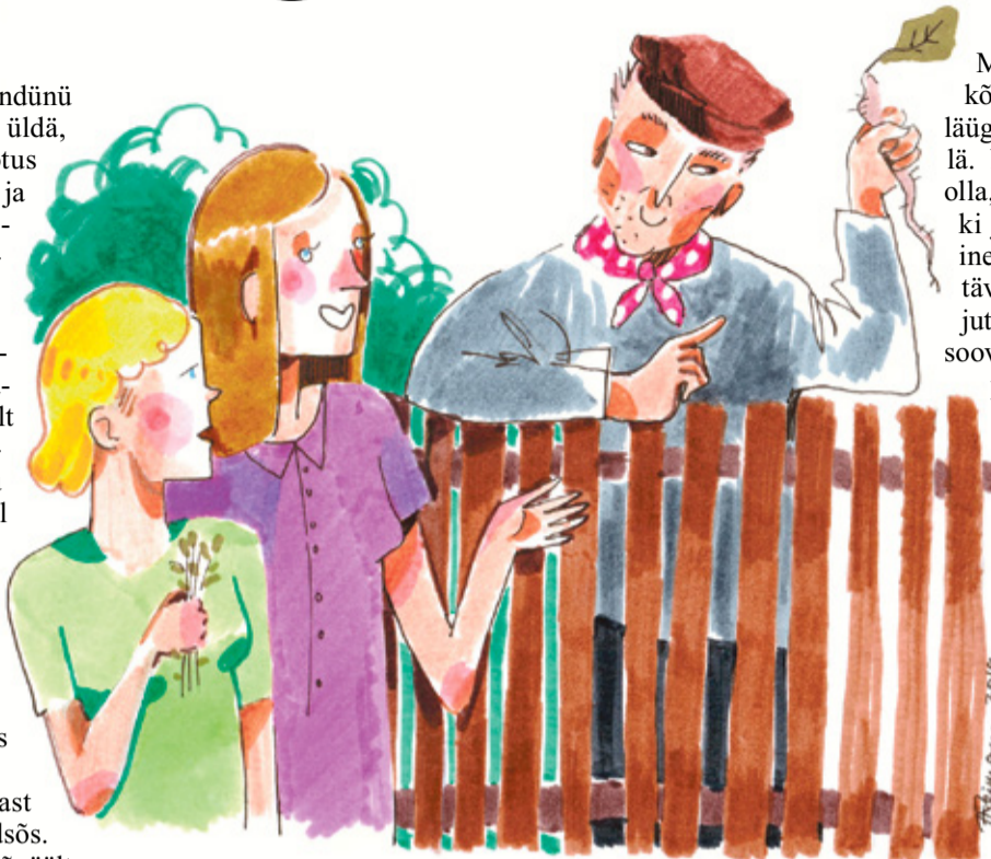
REIMANNI HILDEGARDI TSEHKENDÜS

Perretütär kutsõ liinast hindäle sõpru abilidsõs. Naati asaga pääle. Kõgõpäält sült kiimä. No vanapernaanõ olf iks oppaja ja iistvidäjä, midä sis sündile kiitmise aigu viil leeme sisse panda. Noorõ abilidsõ käve kõõgi ja aia vahet, et säält maiguhainu tuvva. Näil elli piiri pääl naabrimiis, kiä olf Osola pääl