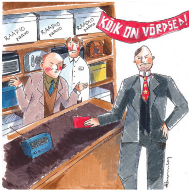
REIMANNI HILDEGARDI TSEHKENDÜS

plassis, paras vaim tull' kah õigõl aol pääle, ni ütäl väega tasalidsõ oppaja-helüga: ega taa paprõ olõ õi teile pildmises antu, taad tulõ kõrralidsõlt hoita. Miis kaie kipõn ulli näoga otsa, kořas piledi karmanihe ni astsõ ussõt vällä. Raadio jätse küll saina viirde saisma.