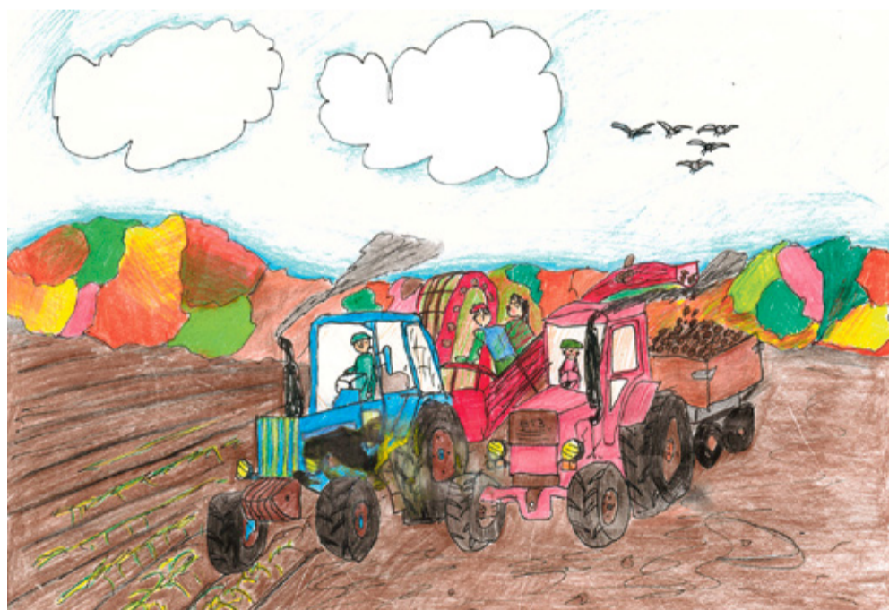
SAARÕ HINDRIKU TSEHKENDÜS