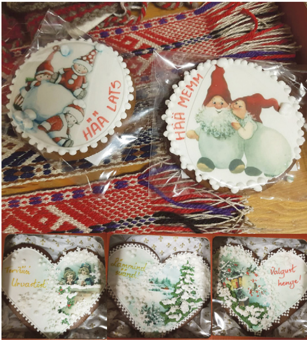
Karille tettü võrokeelitside pühhisuuvõga vehverkoogi.

Urvastõ kandi rahvas saa Karille tettüid vehverkuukõ osta tüüpäiviti Urvastõ seldsima-jast. Ja alatõn 9. jõulukuust omma neo vehverkoogi saia ka Võrol, MTÜ Vana-Võromaa Käsitüü kõrraldõdul jõulumüügil. Tuu tulõ Võro insti-tuudi saalin (Tarto uulits 48). Päält Vana-Võromaa käsitüü ja söögikraami saa säält osta ka võrokeelitsit raamatit ja plaatõ. Täpsebät teedüst jõulumüügi kotsilõ saa kaia seo lehe 1. leheküle päält kuulutusõst.