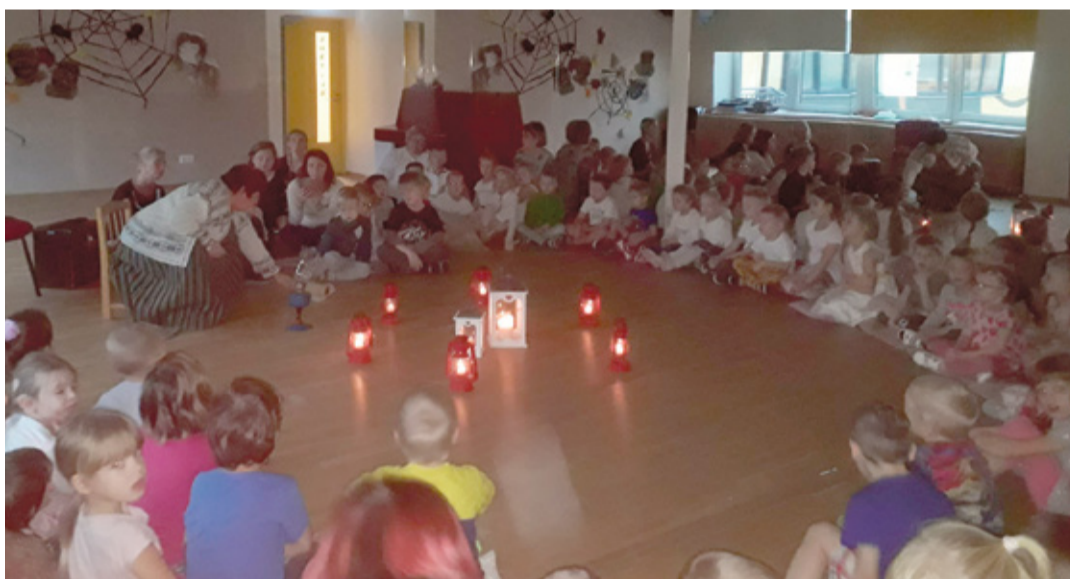
Perimüshummok timahava märdikuul Võrol Sõlõkõsõ latsiaian.