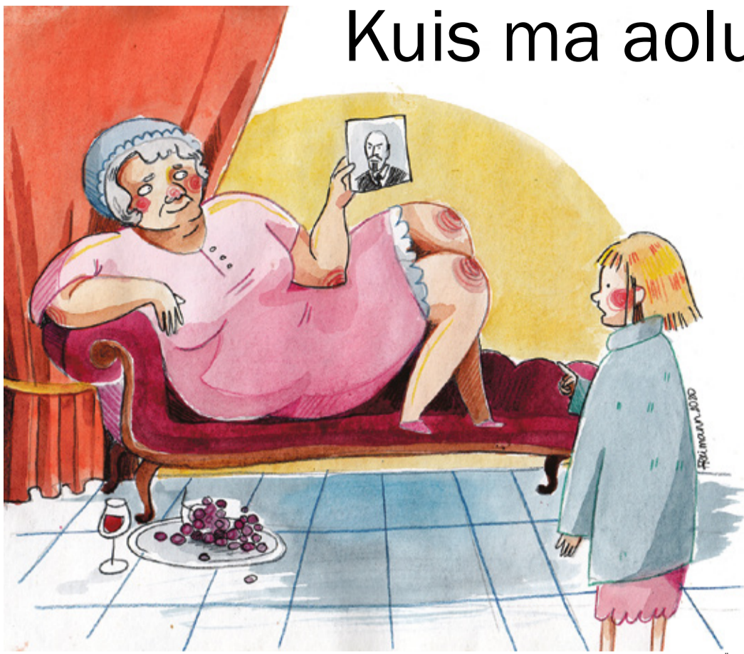
REIMANNI HILDEGARDI TSEHKENDÜS