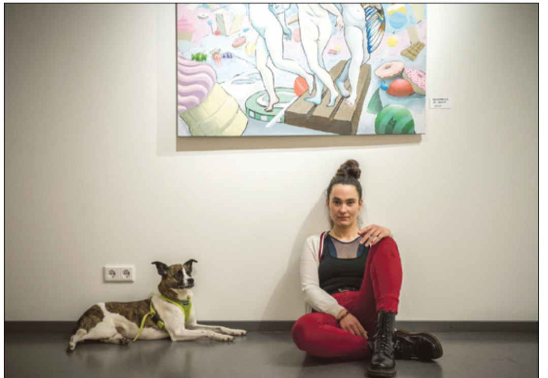
VEETÕUSME JANNE PILT

Ligembät teedüst Vana-Võromaa muusõummõ kotsilõ ja linke näide kodolehti pääle saa kaia internetist aadrõssi wi.ee/muusoumi päält.