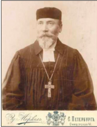
PILT HURDA SELDSI KODOLEHE PÄÄLT.