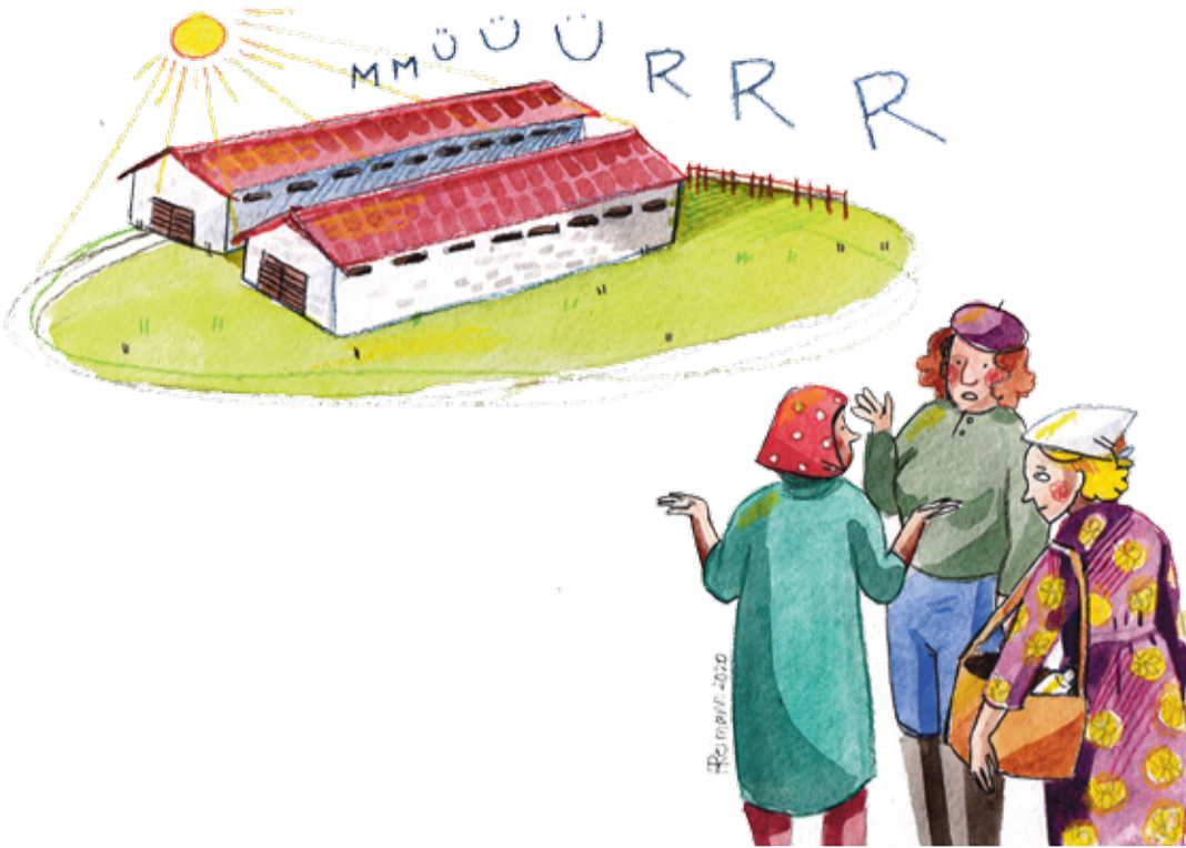
REIMANNI HILDEGARDI TSEHKENDÜS

No sis naksimõ õks tüüle minemä. Tõisi naisi tulf kah. Saimi vast poolõ tii pääle, ku naksimõ veiga imelikku mürinat kuuldma. Midä laudalõ lähembäle, tuud mürrin kõvõmbast lätõ. Saimi arvu, õt lehmä rüüksevä. Näide õigõ nümisaig olf ildast jää-