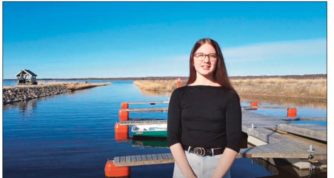
KAADRI VÕISTLUSTÜÜ ESITLÜSVIDEOST

Saarõ Hipp uma kassi Mandaga, kiä om saanu nime otsaedise mandariinikarva laigu perrä.