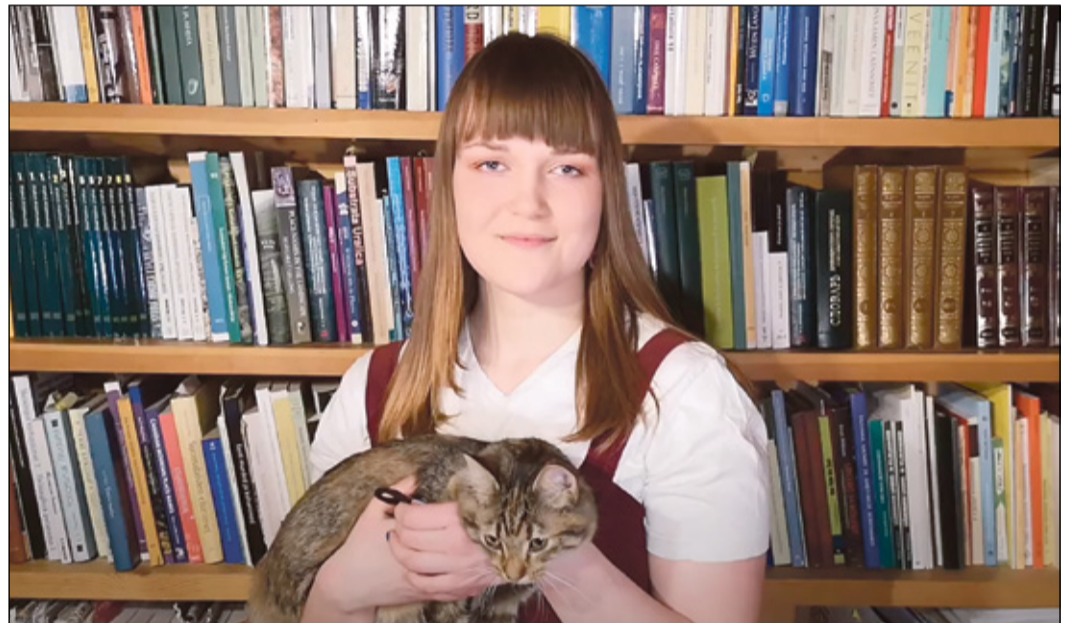
KAADRI VÕISTLUSTÜÜ ESITLÜSVIDEOST

Määndse nime pantas sis Eestin lemmikeläijle? «Kõgõ inämb om Eesti lemmikeläijil inemisenimmi, selle et inemisenimmi om hulga ja inemise võtva lemmikeläijät nigu perrelliigõnd. Hulga om ka vällänagemise ja eläjä umahuisi perrä antuid nimmi, nigu Mustu, Täpi, Triibu. Edesi tulõva egäsugudsõ raamadu- ja filmitegeläisi perrä antu nime, nigu Lotte, Miki, Simba. Viil andas nimmi eläjä helü perrä, mõnõ hellitüssõna, sööginime, asju ja muu perrä. Mu tüüst