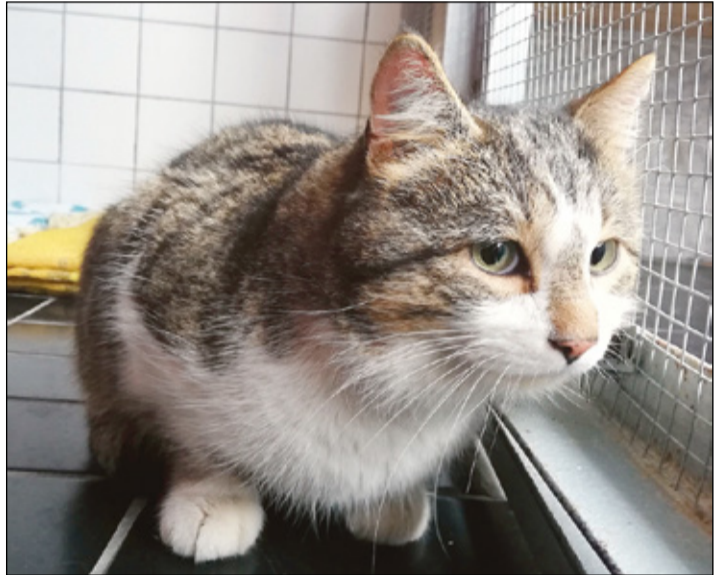
PILT VÕRO ELÄJIDE VAROPAIGA NÄOVIHUST.