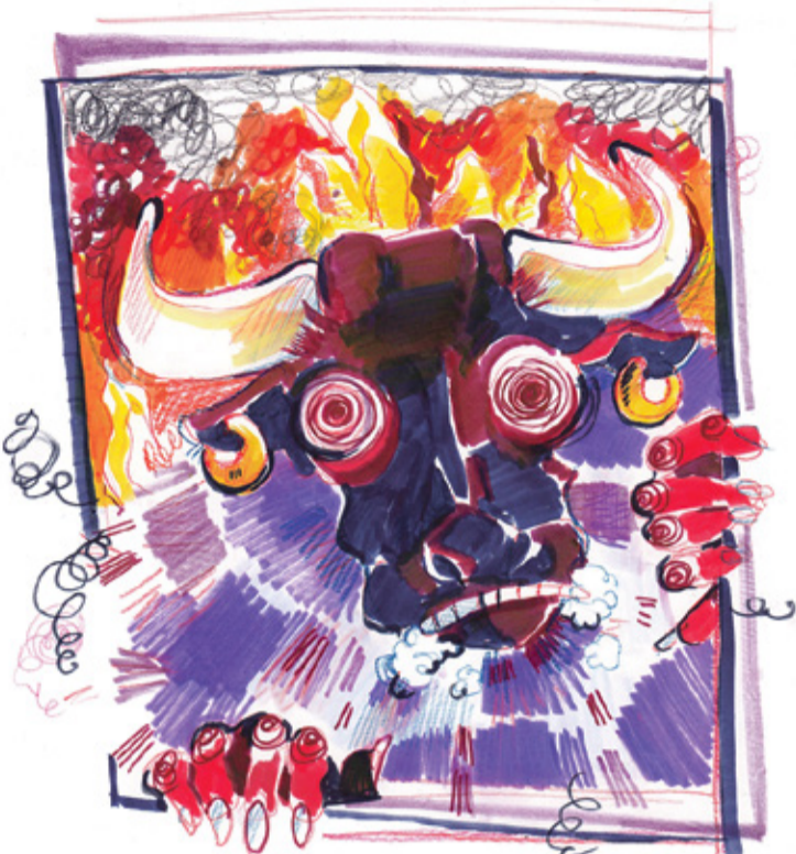
REIMANNI HILDEGARDI TSEHKENDÜS

Tuul meelemõistusõlda olnul aol oll tä tõispuulsõn är käünü. Sääll olli tälle vastatulu vanaimä ja vanaesä ja viil tutvud, sõpru ja sugu-