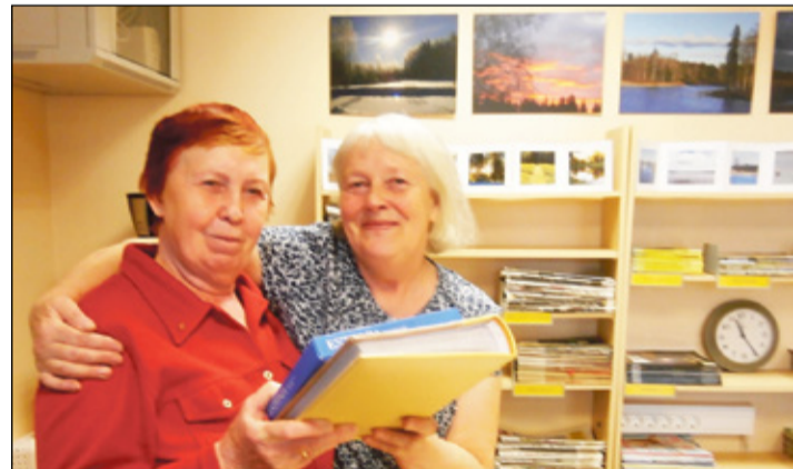
NÖLVAKU KAIE PILT