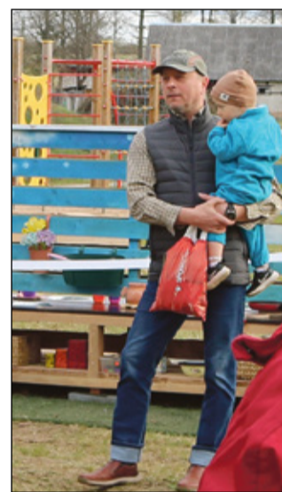
Kunstnik Navitrolla väikut pidokõnõt pidämän.

Säändsit muaküüke, kon latsõ rahuligult plätserdä saava, om muialgi latsiaidun. Ja nii mõnõngi paigan omma latsõvanõmba tuu ütenkuun esi ka üles ehitänü. A Kuldri uma tege esierälidses tuu, et kõõgisaina om maalnu kuulsa kunstnik Navitrolla, kiä om esi kah Kuldri latsiaia latsõvanõmb. Vallategemise aigu kõnõl tä, et pidä latsi muaga mängmist väega tähtsäs, selle et tuu om suurõs abis näide luuvusõ kasvatamisõ man. Uman väikun sõnavõtun lätstä kogoni nii filosoofilidsõs, et nõstsõ mua kõgõ tähtsambäs ašas tan ilman. «Muast olõmi kõik võetu ja muas ka ütškõrd saami,» lõudse Navitrolla.