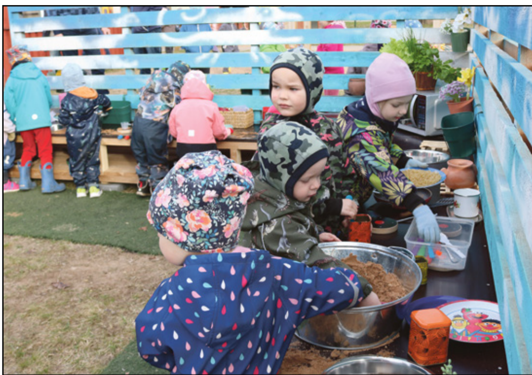
Latsõ omma tormanu suurõ rõömuga vahtsõlõ muaküüki mängmä.