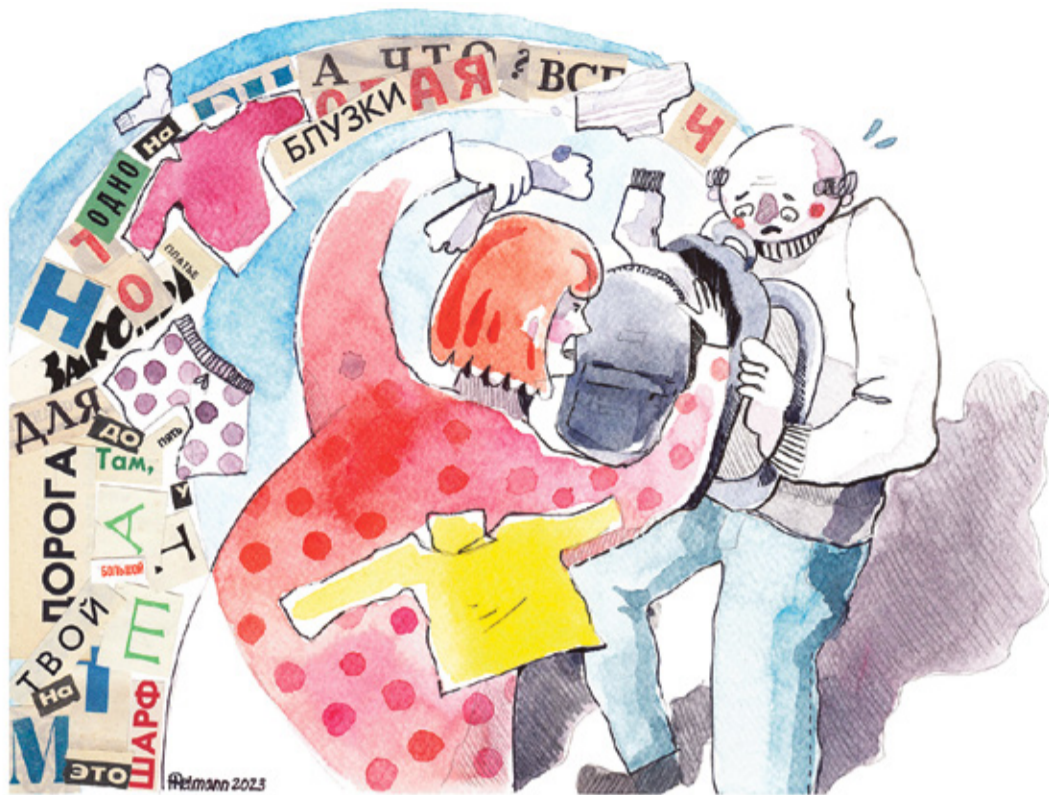
REIMANNI HILDEGARDI TSEHKENDÜS

Kõrragõ võtsõ naanõ mul käest kinni nigu susi oinal turjast ja vei mu polikliiniku trepi pääl 40 meetrit kavvõmbalõ. Kässe mul saista, esi lätsõ auto manu, mis õlf 30–40 miitre takan, ja tull tagasi kotiga, kon õllivõ seen kilekõttõ sisse pakitu rõiva.