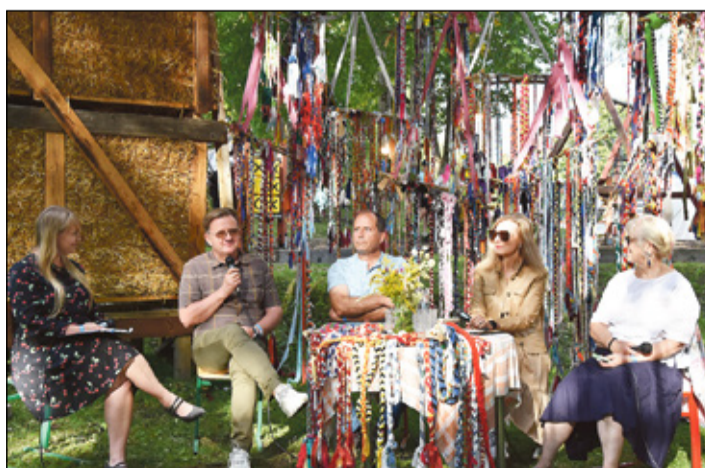
PAAVERI TRIINU PILT

Mahhesüük ja -põllumajandus paistus pallodõ inemiisi jaos innemb luksus ku hädä-tarvidus. Säändsele arvamisõ-