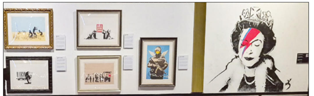
Pildi uulidsakuntniku Banksy muusõumi saina pääl. Et Banksy om innokõkkõ graffitikuntnik, olli muusõumi mõnõ nuka ehitõdu peris uulitsanuka sugumaidis.