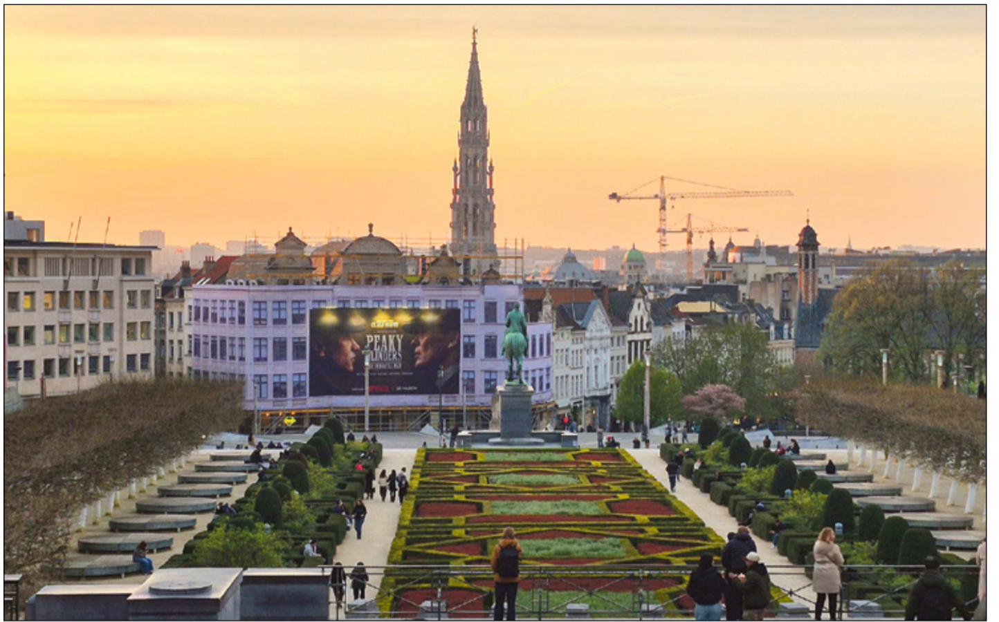
Raamadukogo kõrvalt mäekundi päält saa tetä piltpostkaardi muudu pildi üle Brüsseli vanaliina.