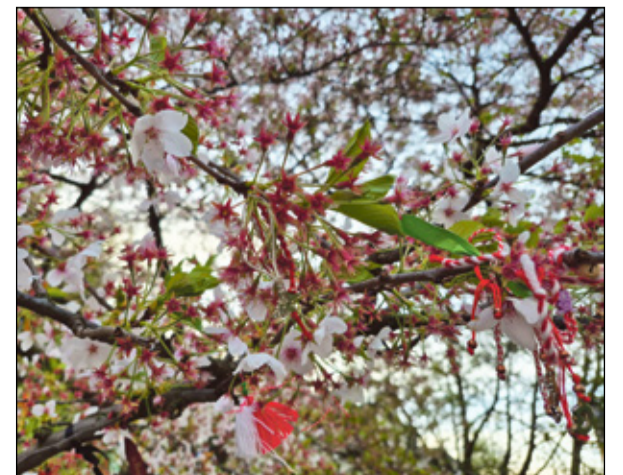
Brüsselin om urbõkuu lõpun tsipa suurõmb kevväi ku meil, mõni puu om joba häitsmit täüs.