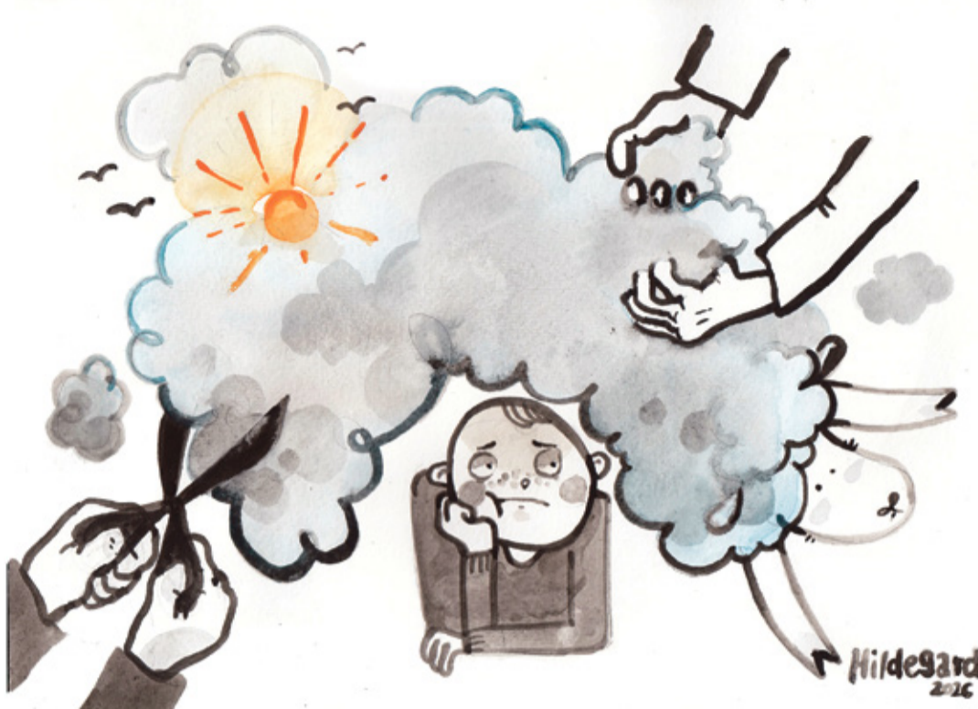
REIMANNI HILDEGARDI TSEHKENDÜS

Nonii, kääri teräväs, lammast sällülde maaha, jala kimmäle kõüdüssehe, et minemä es joosõssi. Pügäjã katsiratsi esi lamba pääl. Kääri otsa tüksevã iks naha sisse kah lõikama, nahk jo liigus eläjã sälläh. Ku kasuk ütõskõrd maaha saadi, sis tult vill är mõskõ. Olõ-i tuu vill kõik ütõ-