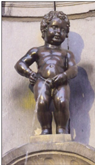
Kuulsa kujo Kusõja Poiskõnõ om oodõtust tsillemb.