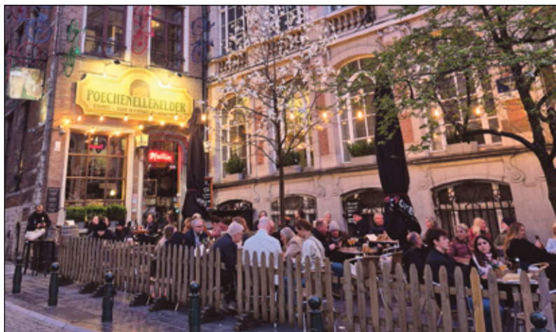
Huulmada küländ jahhest keväjälmast, istus Brüsseli vanaliina väläkõhvikin õdagist hulga rahvast.