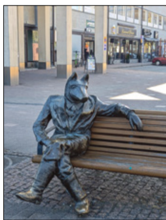
BRAUNI MIHKLI PILT