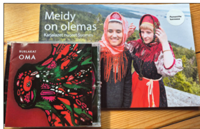
RAHMANI ELO PILT

Tagasitiit pääl istumi edimält rongin võlss kotussõ pääle, a lahkõ suumlasõ ei tii tuust