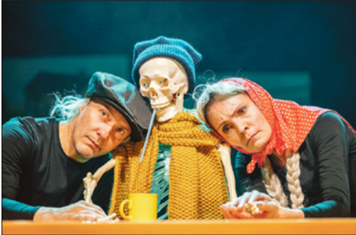
VAHURI SIIMU PILT VAT TIATRI KODOLEHE PÄÄLT

Pildikene etendüesest, nimitegeläne istus kesken.