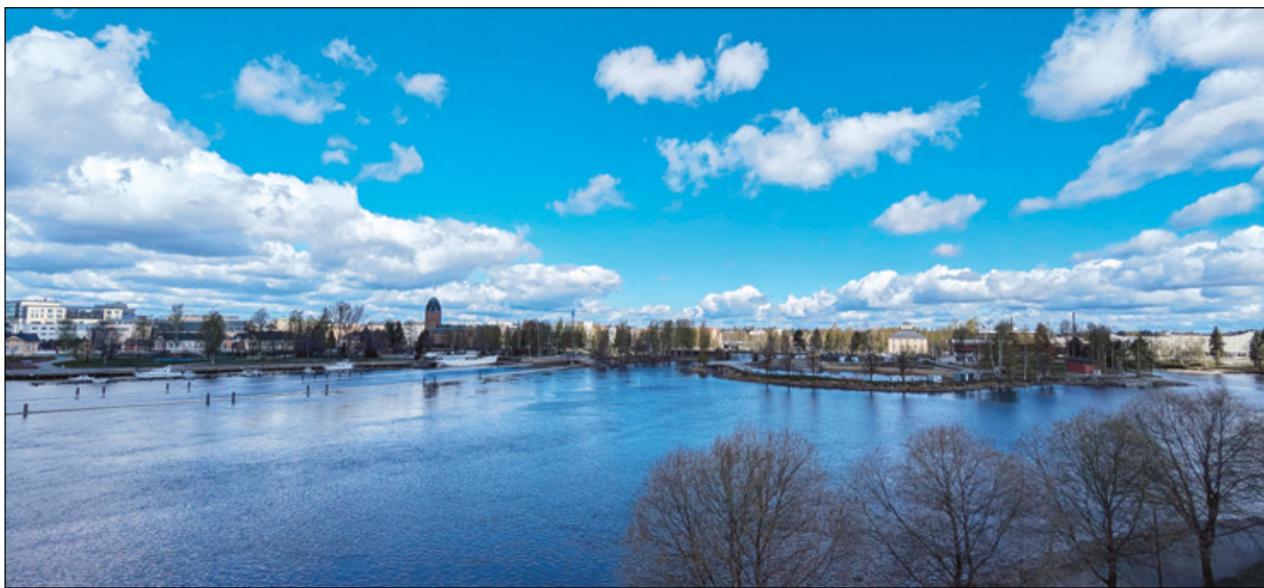
BRAUNI MIHKLI PILT

Hummogu käümi Põha-Karala muusõumin, kon om välläpanõk karalaisist ja näide kul-