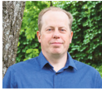
RAHMANI JANI PILT

Inne jaanipäävä 1988. aast- tal tetti tagasi Kolga-Jaani kerko man olnu Vabahussõa mälehtüsmärk. Pääle tuud na- kaš egäl puul mälehtüsmärke tagasitegemine. 23. piimäkuu