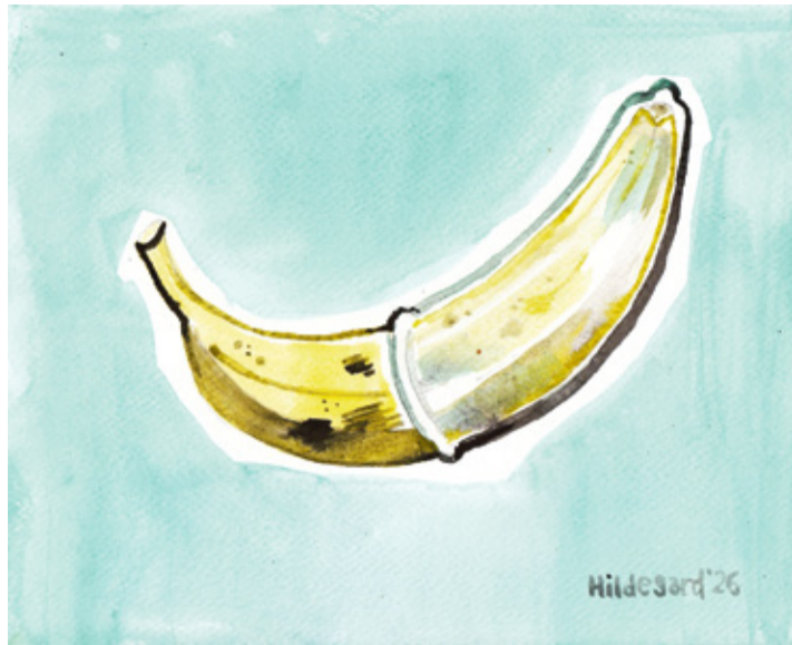
REIMANNI HILDEGARDI TSEHKENDÜS

Olkõ, et plessi pääga ümärik arvudioppaja olf Rate.ee koolin kinni pandnu, saimi peris kipõstõ teedä, kuis too-lõ elõlõsõlt tähtsäle lehele mano saia. Saimi säält sõbrannadõlõ, kiä saman klassi-tarõn puutre takan istsõva, sõnomit saata, hindäl kõrvun, kuis oppaja hirmsa räginäga inglüse kiilt kõnõlõs: «Vali hvail, sis seiv ääääs.» Uma-ette hindsiten olõs piaaigu silmist lipsanu, kuis Rate'i olf vahtõnõ sõnnom tulnu. Oo, määneki Võro nuurmiis, a kimmähe mitte mi koolist,